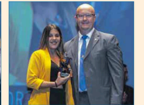
Mayor Proyección Nacional e Internacional: Andrea Galván Pavón