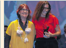
Promoción del Deporte Base: Club Waterpolo Dos hermanas