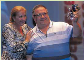
Juego Limpio: Baloncesto en Silla de Ruedas Vistazul