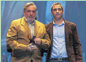
Distinción extraordinaria: Club Balonmano Nazareño

Los vídeos emitidos en la XXXIX Gala del Deporte Nazareño los puedes ver en: www.doshermanas.net