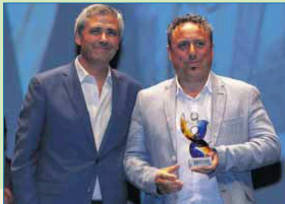
Promoción del Deporte Base: La Moneda C.F.