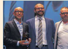
Deporte Local: Equipo May Flays