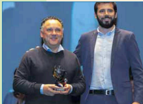
Mejor Entidad Deportiva: Club Gimnasia Rítmica Dos Hermanas