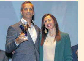
Colaboración con el Deporte: Policía Local