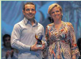
Mención Especial: Club Deportivo Draco