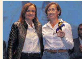
Promoción del Deporte por la Igualdad: C.D. Escolapios Montequinto