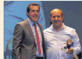
Promoción del Deporte por la Igualdad: Equipo de Fémimas Dos Hermanas Team Ameral