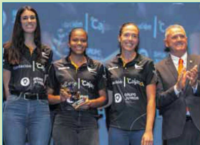
Mejor Equipo: Equipo Senior Club Voleibol Esquimo